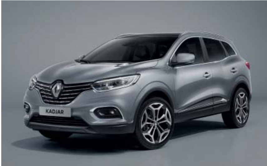
Gris Highland (TE)