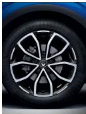
jante alliage 18" Fleuron diamantée noir