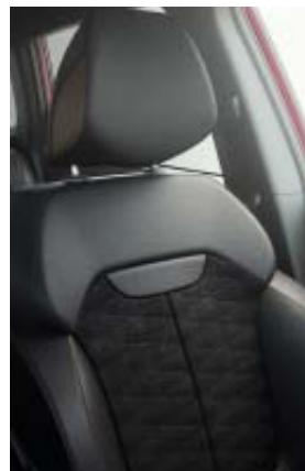
sellerie mixte similicuir / alcantara® avec surpiqûres bronze (Black Edition)