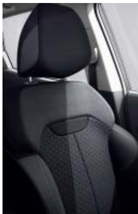
sellerie tissu 3D fond gris avec surpiqûres (SL Limited)