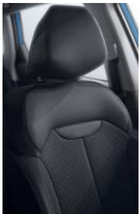
sellerie tissu noir (Zen)