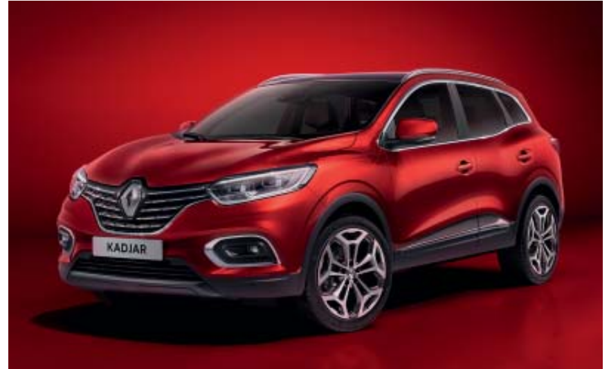
Rouge Flamme (TE)

TE : peinture métallisée OV : opaque verni photos non contractuelles