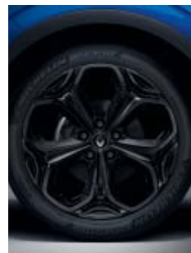
jante alliage 19" Bandana diamantée noir