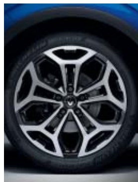
jante alliage 19" Yohan diamantée gris