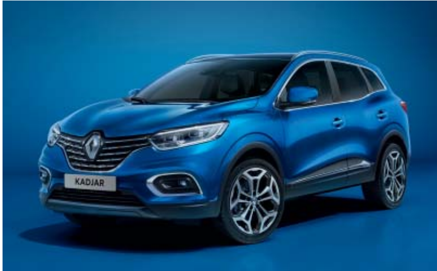
Bleu Iron (TE)