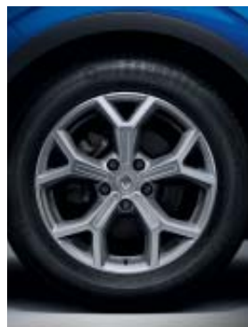
jante alliage 17" Evado