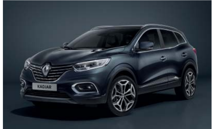
Gris Titanium (TE)