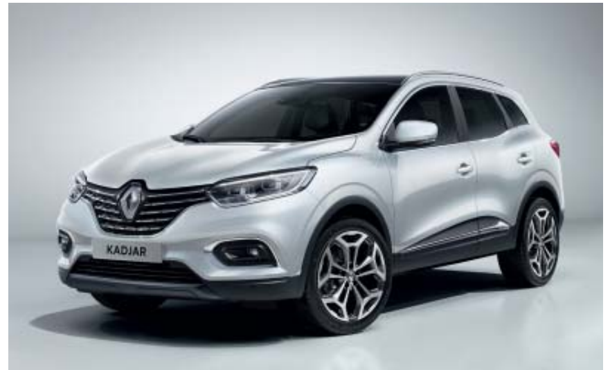
Blanc Glacier (OV)