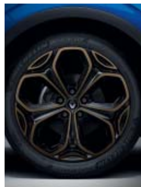
jante alliage 19" Bandana diamantée bronze