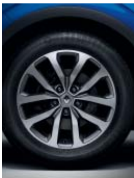
jante alliage 17" Aquila diamantée noir ou gris