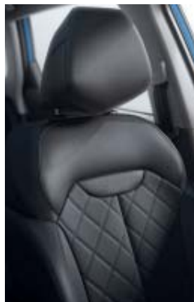
sellerie mixte similicuir / tissu (Intens)