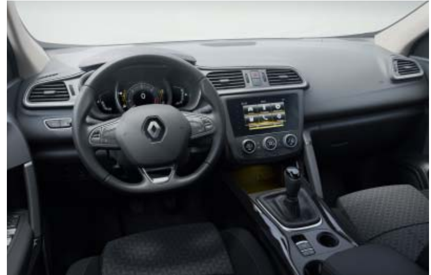
SL Limited (Zen+)