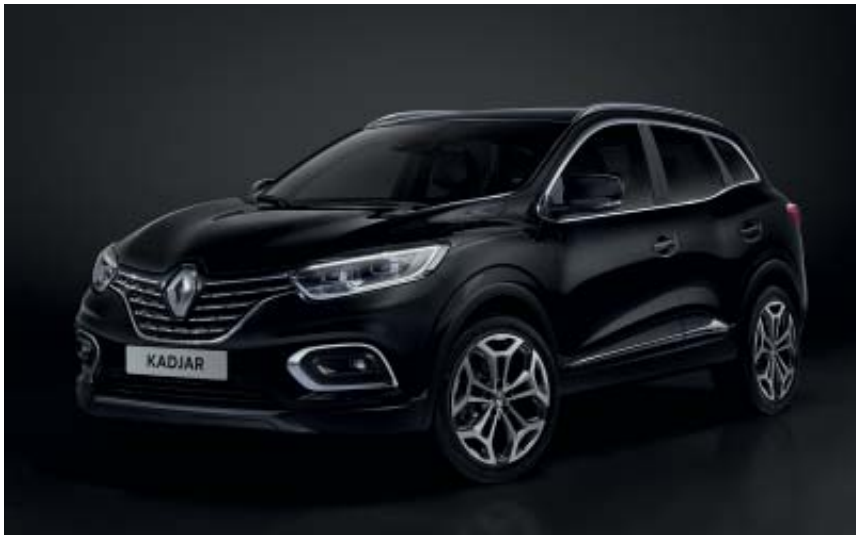
Noir Étoilé (TE)